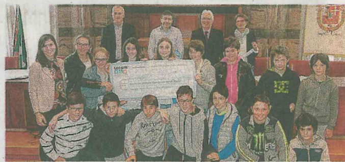
Alle prime medie di Aprica il terzo posto