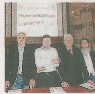
Organizzatori e giurati